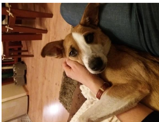
Latte w swoim domu ☺

Gdyby nie Wy Latte nie byłaby dziś tak szczęśliwa! Po stokroć Wam dziękujemy!