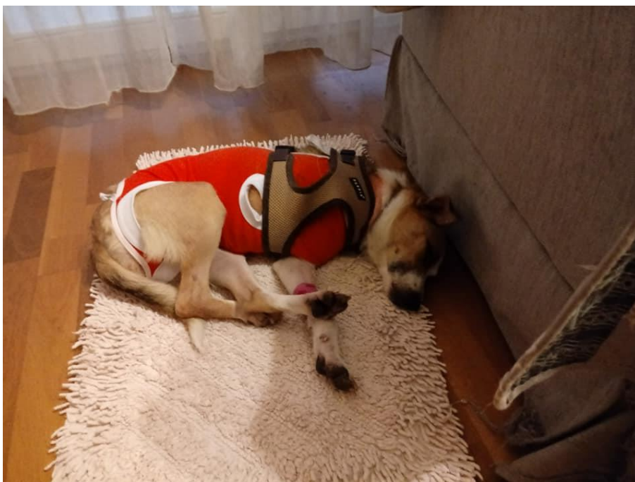
Latte po zabiegu

Oprócz zabiegu amputacji kikuta łapki, Latte została także odrobaczona – koszt 40 zł, wysterylizowana – koszt 400 zł, przeszła badania krwi oraz echa serca – koszt 200 zł.